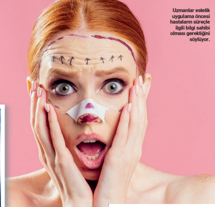
Uzmanlar estetik uygulama öncesi hastaların sürece ilgili bilgi sahibi olması gerektiğini söylüyor.

■ Hastalarımız, sağık durumumuz nedeniyle ameliyata engel olabilecek konular ya da kullandığımız ilaçlar varsa bu bilgileri ameliyat öncesinde doktorunuza paylaşmalısınız. Genelde estetik ameliyat için sağık durumunuzun iyi olması ve 17 yaşın geçmesi önemlidir. Son estetik ameliyatlarımız 65-70 yaşlarına kadar yapıyoruz. Daha yaşlı kişilerde estetik ameliyat yapmak uygun değil. ■ Hastamız ne istediğini iyi tanımlaması lazım. Mesela bir yüz germe ameliyatı söz konusuysa beklenti, yüzün daha güzel gözükmesi mi, daha dınc bir ifade mi, daha pozitif bir yüz ifadesi mi; bunların en baştan hastayla konuşulması gerekiyor. Beklentinin gerçekçi olup olmadığı araştırılmalı, konuşulmalı. ■ Artık her şeyin bir alternatifi oluyor